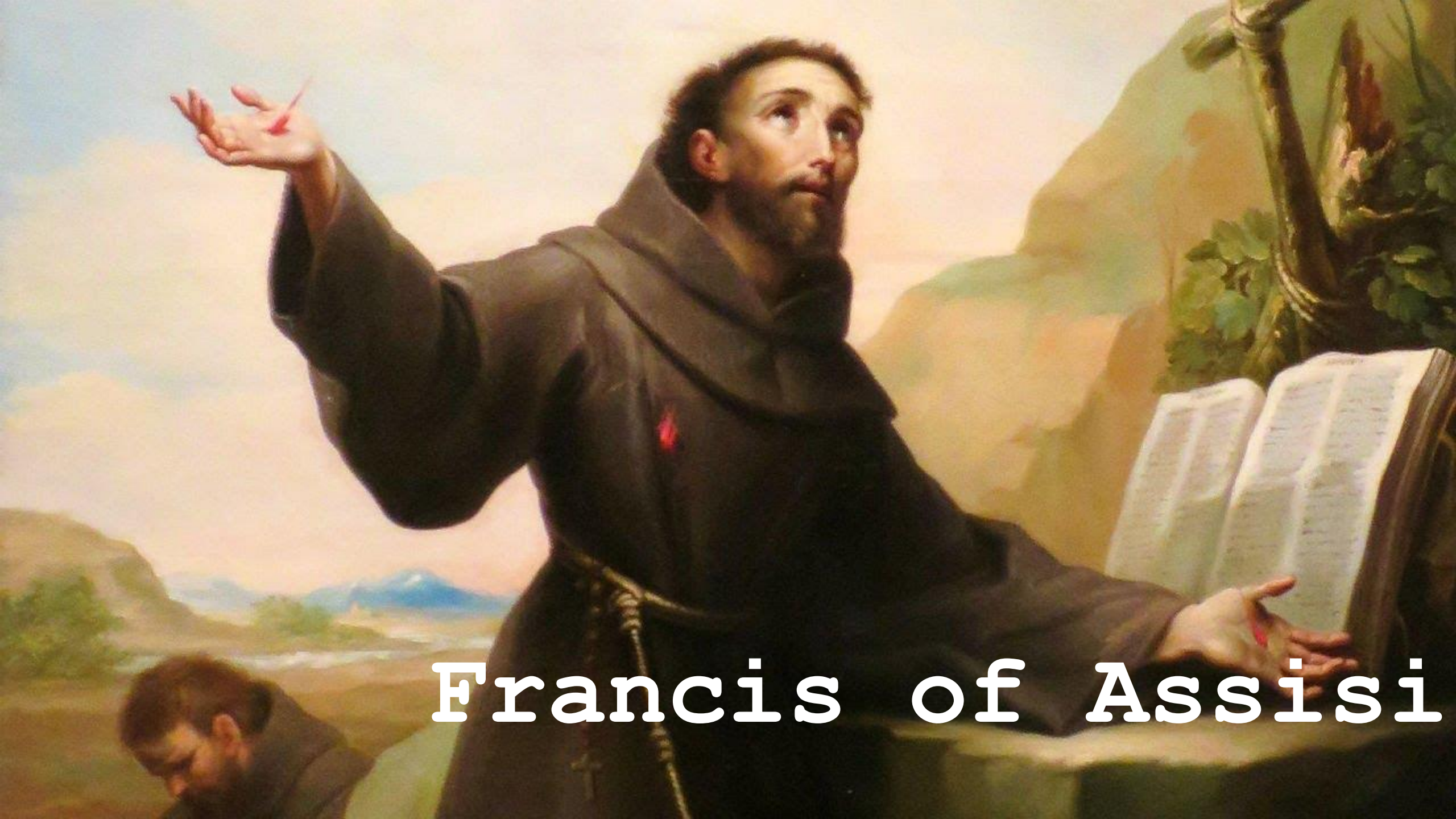
Francis of Assisi